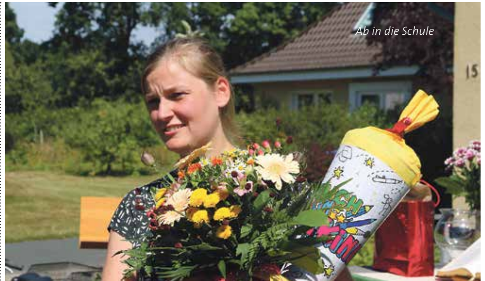
Ab in die Schule

Ich erinnere mich daran, wie die Pandemie alles auf den Kopf stellte und wir gemeinsam Schritt für Schritt neue Wege gegangen sind.