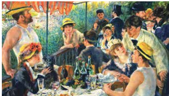
Pierre-Auguste Renoir: »Das Frühstück der Ruderer«