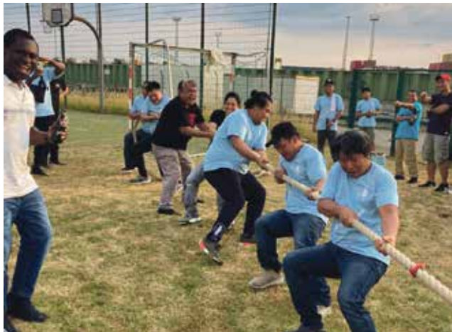
Kräftemessen beim Tauziehen: Die Seeleute legen sich heftig ins Zeug.

Häfen in aller Welt feiern einmal im Jahr den Tag des Seefahrers. Finanziert wurde das dies-