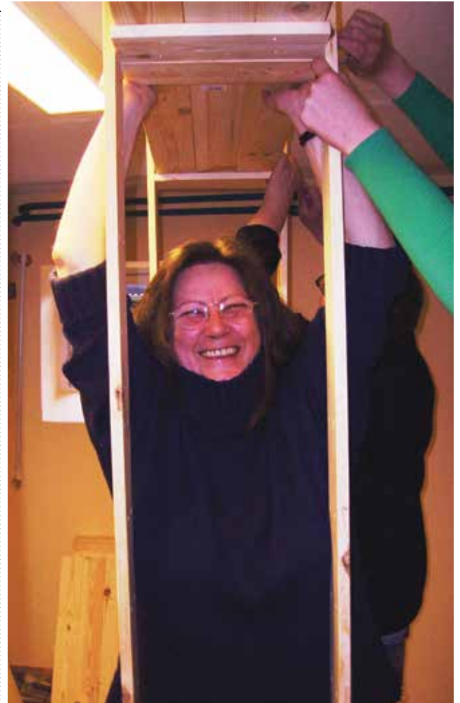
Beim Umbau des Jugendraums im Martin-Luther-Haus 2008

Ja, ich empfinde es als bedrückend, dass im Laufe der Jahre in unterschiedlichen Arbeitsgruppen im Kirchenkreis nicht mehr an einem Strang gezogen