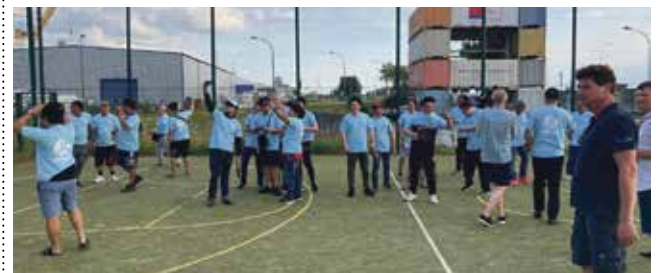
Stolze Crews in Hellblau: »Proud to be a seafarer« steht in weißen Lettern auf den T-Shirts, die am »Day of the Seafarer« an alle Seeleute verteilt wurden.