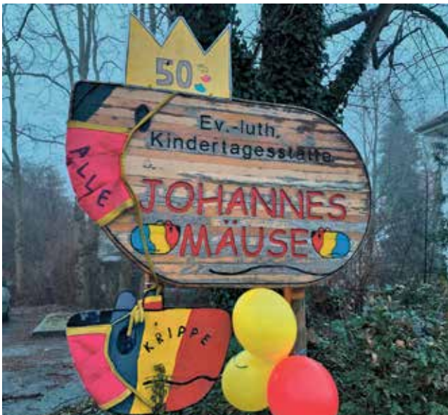
Zum 50-jährigen Jubiläum wird der Maus die Krone aufgesetzt: Die Ev.-luth. Kita Johannesmäuse zeigt, dass es etwas zu feiern gibt.

Die Kita Johannesmäuse in Bremerhaven-Speckenbüttel wurde am 1. März 1971 in Betrieb genommen. Sie ist in Trägerschaft des Ev.-luth. Kirchenkreises Bremerhaven und bietet 40 Plätze für Kinder im Alter von 3 bis 6 Jahren, in zwei altersgemischten Gruppen. Darüber hinaus stellt sie 8 Krippenplätze für Kinder ab 8 Wochen bis 3 Jahren bereit.