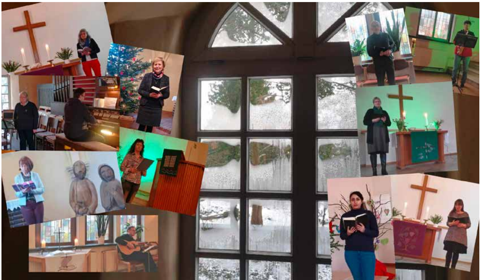
Szenen aus den Videogottesdiensten

P.S.: Ab dem 28. März sind wieder gemeinsame Gottesdienste in den Kirchen geplant. (Siehe dazu den Beitrag »Endlich wieder ...«.)