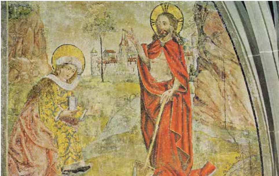
Maria Magdalena und Jesus als Gärtner (Johannes 20,15), Kreuzgang Konstanzer Münster