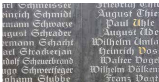
Marmortafel in der Turmhalle der Pauluskirche.