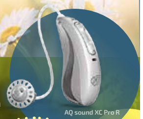
AQ sound XC Pro R

Telefon-Streaming: Mit Bluetooth® 4.2 und den meisten älteren Bluetooth®-Telefonen. Der Begriff Bluetooth® und die Logos sind eingetragene Marken der Bluetooth SIG, Inc. TV-Streaming: Voraussetzung TV-Connector am Fernsehgerät angeschlossen.