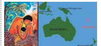
Vanuatu – eine kleine Inselgruppe im Pazifik

schlag mit Texten zum Nachlesen. Eine schöne Veranstaltung war möglich gemacht worden. Dank an alle Besucherinnen und Besucher und das Team.