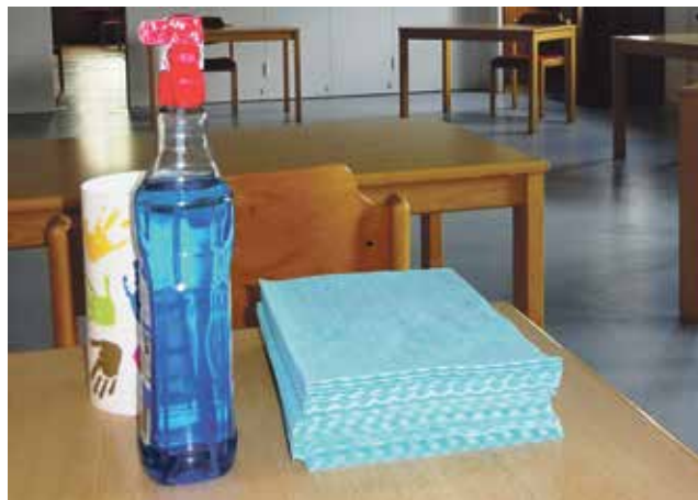
Begrenzte Plätze und Reinigungsmittel im Saal

Da niemand mit Sicherheit voraussagen kann, wie die Situation sich verändern wird und ob es mehr Lockerungen oder aber auch Verschärfungen der Maßnahmen geben wird, gelten alle hier genannten Regelungen bis auf Weiteres.