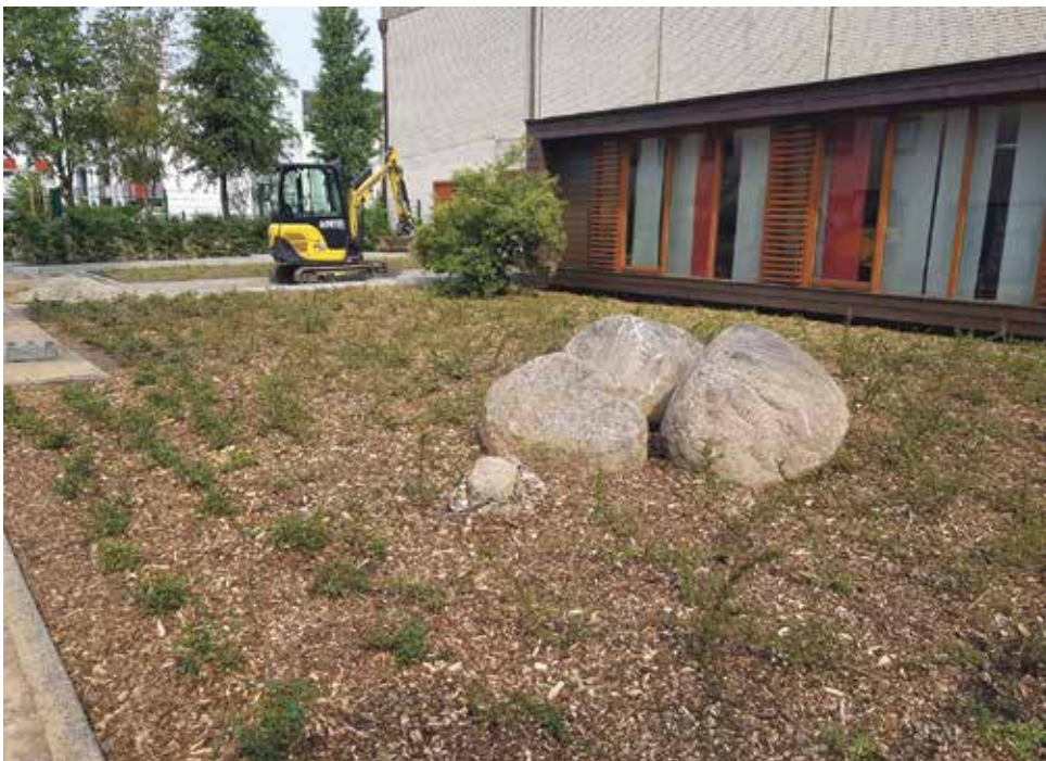
Wer will fleißige Handwerker sehen? Die Gärtner gestalten das Außengelände des Michaeliszentrums neu!

Bestatter konnten sich den Bau aus Buchenholz bereits anschauen und sind durchweg begeistert. »Das wird richtig gut«, ist der Kolumbariumsausschuss überzeugt.