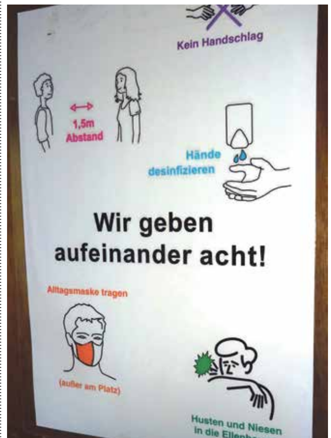
Hinweisschild vor Gemeinderaum nach vorsichtiger Öffnung

ANMERKUNG: Bitte beachten Sie den Artikel »Wenn wieder ein bisschen was geht ...«