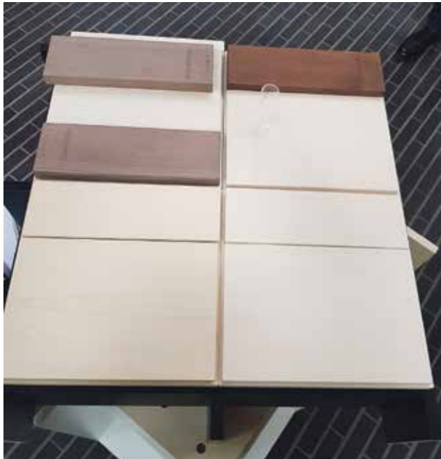
So werden die Urnschreine aussehen: Auf einer Platte aus edlem amerikanischen Nussbaum wird der Name verewigt werden.

Auch innendrin sind die Veränderungen sicht- und spürbar. Die Gemeinderäume sind bereits fertig und in Gebrauch;