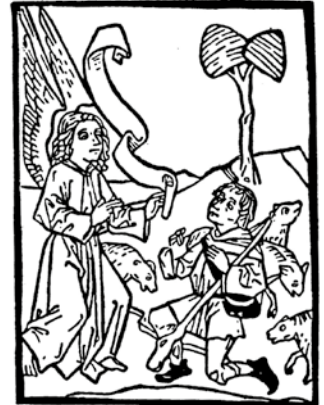
Auch ist so seltsam leucht die Nacht, gleich als schien der helle Tag: die Sternlein glanzten als lauter Sonnen

Altersgruppen geeignet sind. Falls Sie Ihren Kirchgang also ganz gezielt planen möchten: Heiligabend um 15.30 Uhr in der Dionysiuskirche ist eher für kleinere Kinder gedacht, Heiligabend um 15.30 Uhr in der Martin-Luther-Kirche kann eher von größeren Kindern verstanden werden. Wie auch immer: herzlich willkommen!