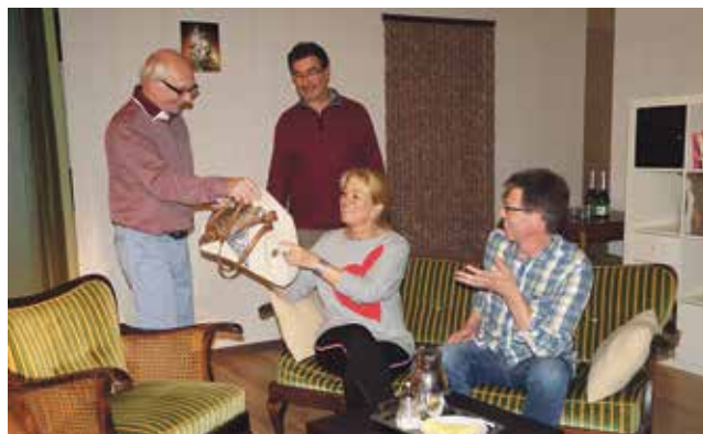
Die Bühne am Jedutenberg bei einer Probe der neuen Komödie