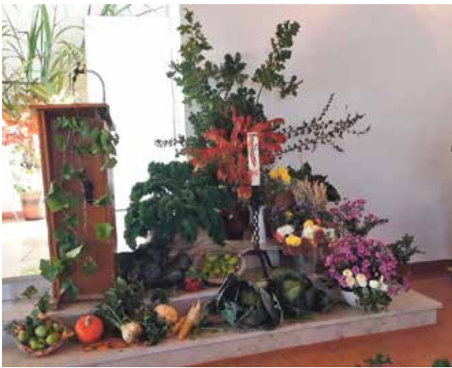
Auch in diesem Jahr waren unsere Wulsdorfer Kirchen wunderbar zum Erntedankfest geschmückt!