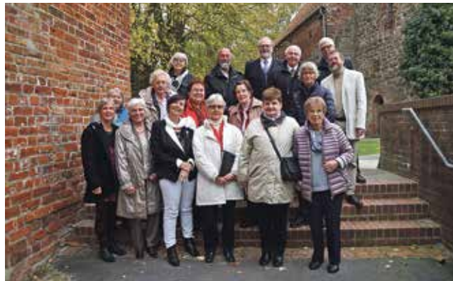
Unser Kirchenchor - singen macht Spaß!