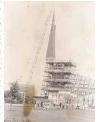
Richtfest der Auferstehungskirche