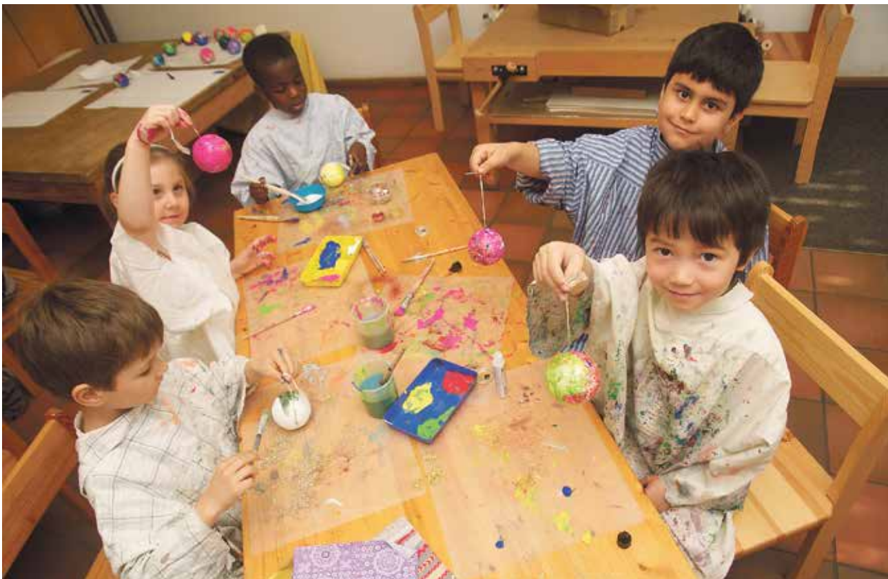
Kinder gestalten Weihnachtbaumkugeln