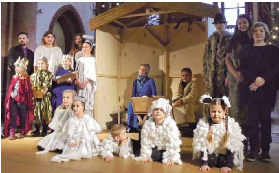
Familiengottesdienst mit Krippenspiel, dargestellt von Kindern aus der Kinderkirche. Am Heiligabend um 14.30 Uhr in der Christuskirche mit kindgerechtem Krippenspiel für Kinder im Kindergarten- und Grundschulalter und deren Familien.

10.00 Uhr: . . . Festgottesdienst mit Weihnachtsliederwunschkonzert, Pastor Langhorst