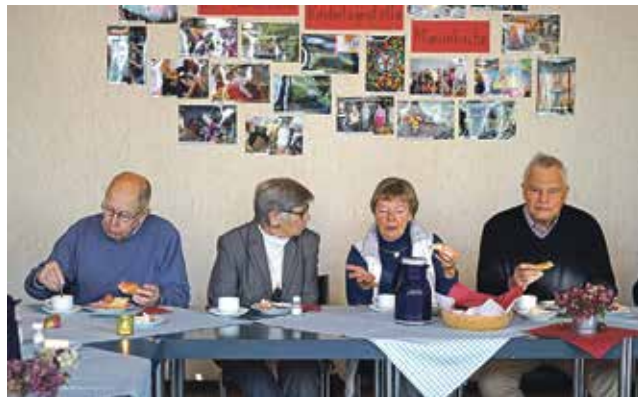
Vier Nachbarn aus der Mushardstrasse.

Es war schön, von Angesicht zu Angesicht miteinander zu reden und zu entdecken: »Was, Sie sind meine Nachbarin?«