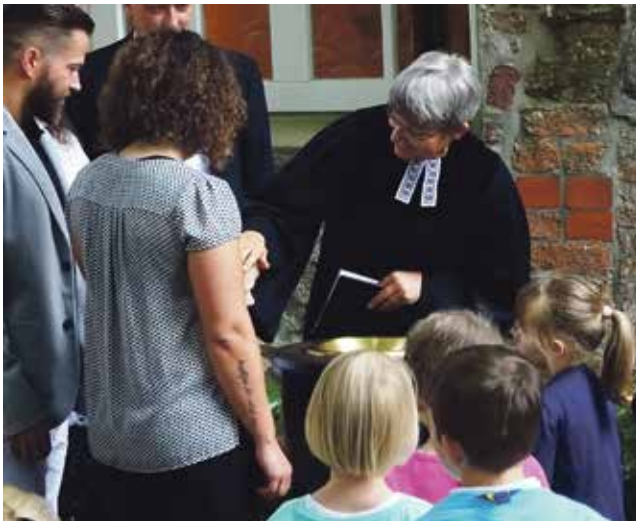
Fünf Kinder wurden im Gottesdienst getauft.