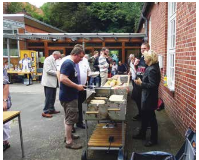
Nach dem Gottesdienst gab es Würstchen, Kaffee und Kuchen.