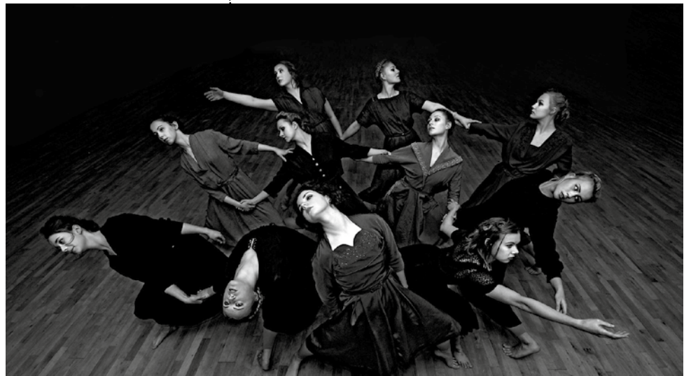
Foto: Die Tanz-Etage.

Die Karten kosten 15 Euro und ermäßigt 8 Euro. Sie sind erhältlich an allen VVK-Stellen der Stadt, online unter www.kulturkirche-bremerhaven.de sowie an der Abendkasse.