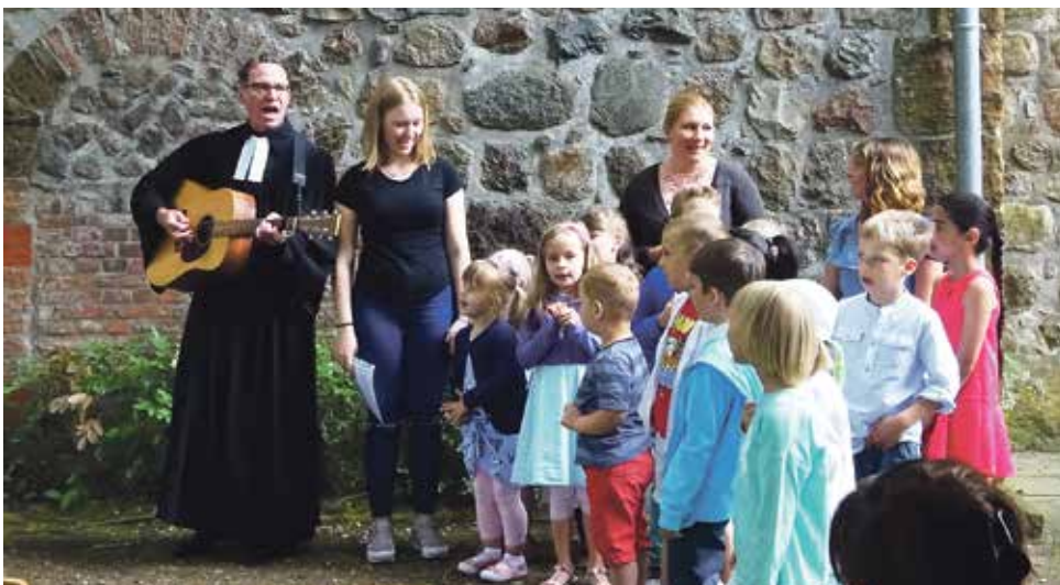
Kinder der KiTa Mikado sangen zwei Lieder.