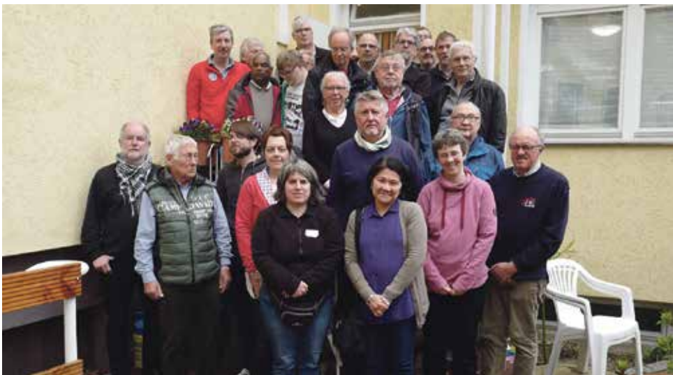
Die Bordbesucher aus den Häfen Bremen, Bremerhaven, Brake, Nordenham, Stade-Bützfleth, Cuxhaven, Hamburg, Lübeck, Kiel und Wilhelmshaven nutzten die Gelegenheit, sich über ihre Arbeit auszutauschen und voneinander zu lernen.