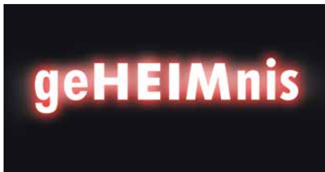
Ein Objekt der Ausstellung: geHEIMnis.

Dienstag bis Sonntag | 15-17 Uhr Mittwoch und Samstag | 9.30-12 Uhr. Bitte achten Sie auch auf die weiteren Veröffentlichungen oder schauen Sie zu gegebener Zeit unter www.kulturkirche-bremerhaven.de nach.