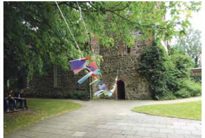
An das gemeindeverbindende Seil wurden viele Blätter mit Anregungen für die Gemeinde und den neuen Kirchenvorstand gehängt.