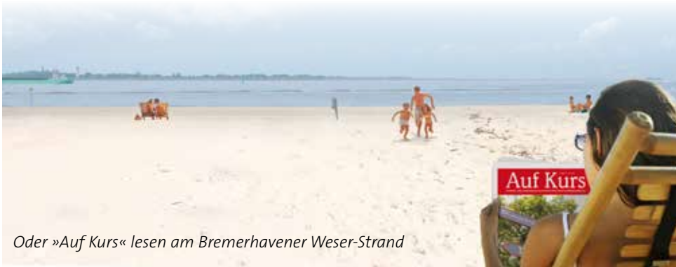
Oder »Auf Kurs« lesen am Bremerhavener Weser-Strand

Einen schönen Sommer wünschen wir Ihnen.