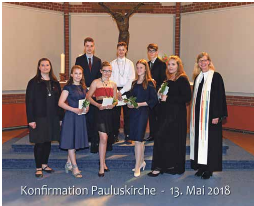
Konfirmation Pauluskirche - 13. Mai 2018

Konfirmation der Konfirmanden der Kreuz-, Michaelis- und Pauluskirchengemeinde am 13. Mai in der Pauluskirche